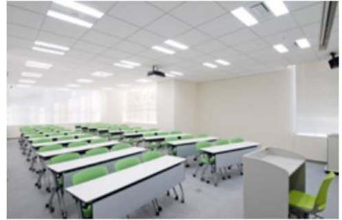
専修大学 サテライトキャンパス スタジオ A (117.04 m 2 )