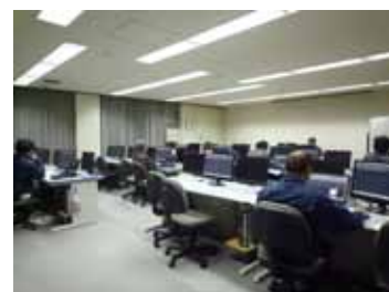
サブモニターで講師の操作を確認