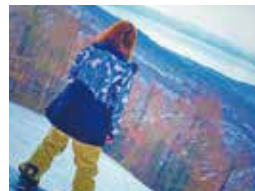
友人からの誘いでスノーボードに熱中。冬場は連日スキー場へ。