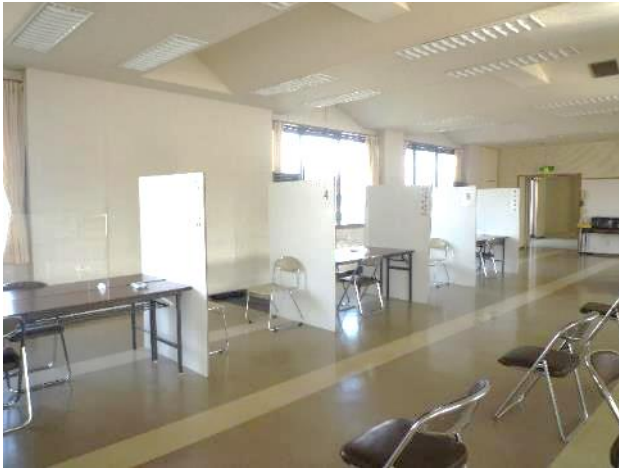
※人材育成センター会場の写真です