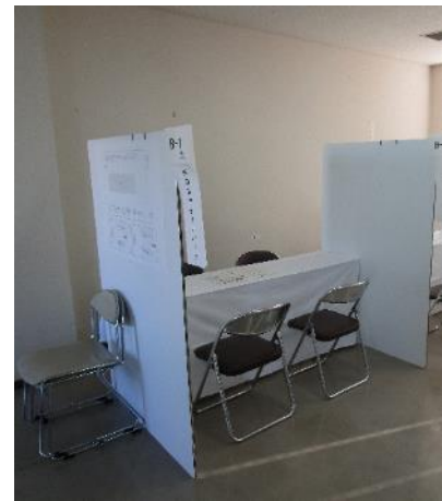
個別ブースイメージ