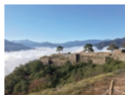
旅行は学生の頃からの趣味。長期連休を利用して全国を巡る。