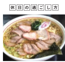
マイブームは白河ラーメン店巡り。100軒を超える店がある。