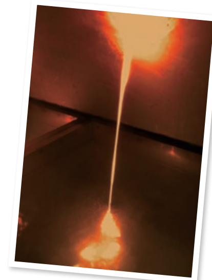
矢祭町 日本珪瑯釉薬(株) 矢祭工場