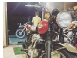
天気の良い休日にはバイクでツーリングに出かける。