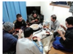
休日には気の合う仲間と出掛けたり食事会を楽しむ。