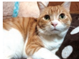
ベッドと過ごせるのは実家暮らしの 良さのひとつ。