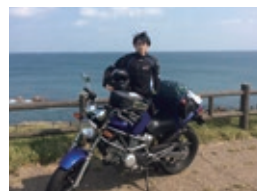
休日はバイクに乗って山道や自然の中を走る。