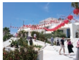
非日常の体験で気分もリフレッシュできる。