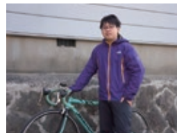
休日は、サイクリングで自然を満喫。 心も身体もリフレッシュ!