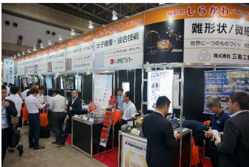
第22回 機械要素技術展 (H30. 6)