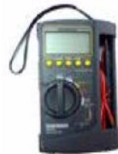
練習盤とテスター