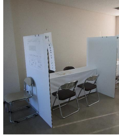
個別ブースイメージ