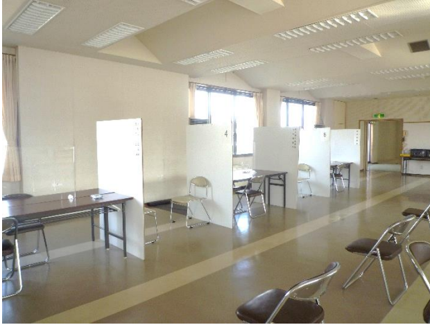
※人材育成センター会場の写真です